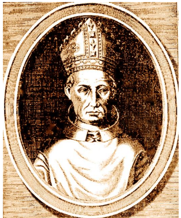
Pierre de Selve, dit Pierre de Monteruc

Riche, Pierre de Monteruc décide dès 1375 de fonder un collège à Toulouse qui sera ouvert le 4 février 1382 sous le nom du Collège Sainte Catherine. Ce collège, qui accueillera des